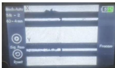
Error de fusión

SE SUGIERE REALIZAR UN MANTENIMIENTO AL EQUIPO YA QUE ESTO ALARGA LA VIDA UTIL DEL EQUIPO, SE SUGIERE CAMBIAR LOS ELECTRODOS YA QUE LOS QUE TIENE ACTUALMENTE NO CORRESPONDE AL MODELO DE LA MAQUINA.