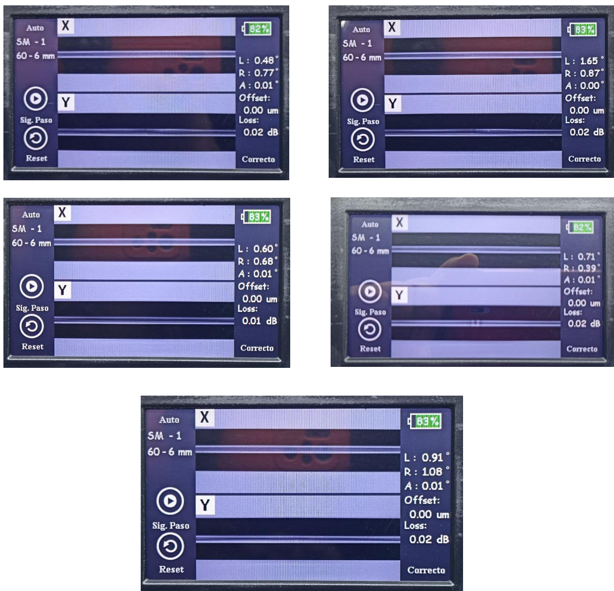
Img 3 Resultados de las fusiones