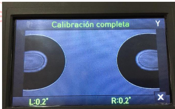
Img 2 Calibracion de equipo completa

Ya inspeccionada la maquina se procede a limpiar los electrodos. Se estabilizan y calibran, luego se realiza la limpieza de; cámaras, leds y holders, quedando totalmente operativo (Ver Img 2 ). Obteniendo los siguientes resultados de empalme.