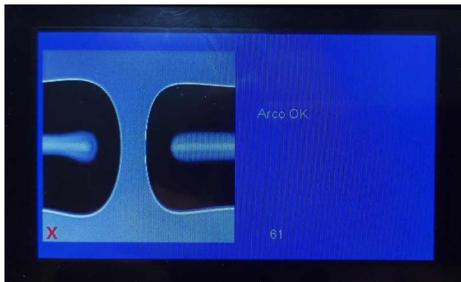
Img 3 ajuste de arco OK